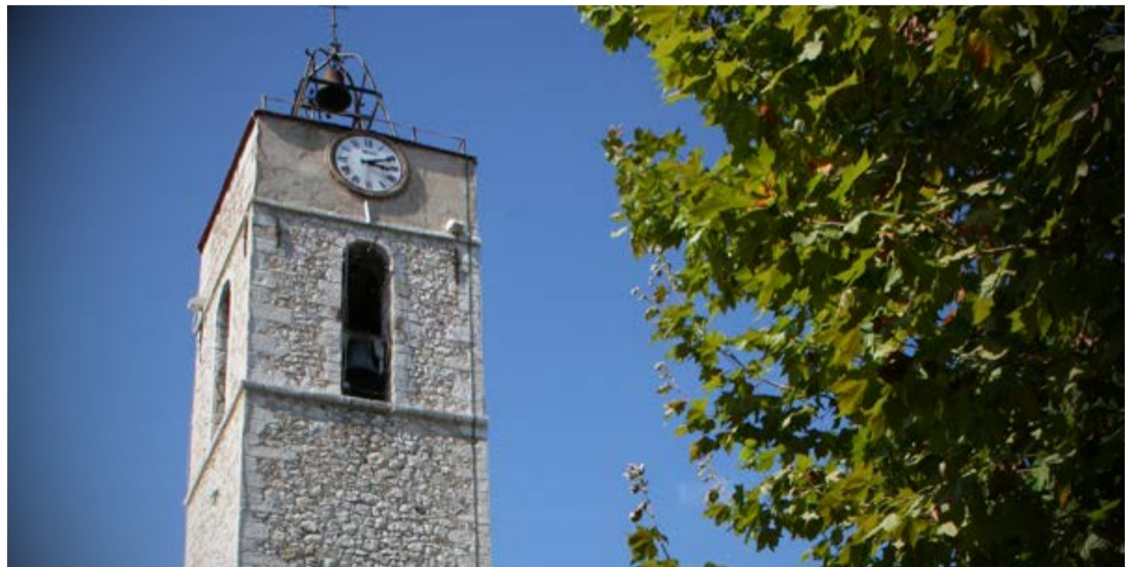
Il faudra des mois, voire des années de travaux pour que l'église redevienne un lieu sûr pour les fidèles.